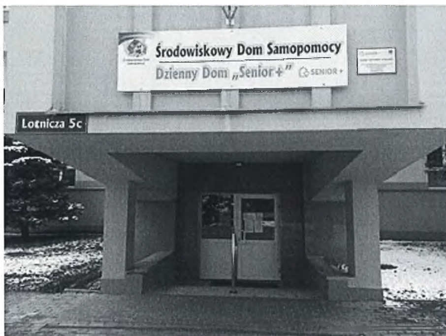
fot. Dzienny Dom „Senior+” w Bielawie- wejście.