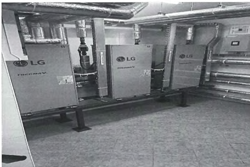
fol. Środowiskowy Dom Samopomocy w Oleśnicy Małej – Pompa ciepła powietrze-woda 3x16kW.

W wyniku zrealizowanego przez Gminę Oława zadania inwestycyjnego pn. Modernizacja Środowiskowego Domu Samopomocy w Oleśnicy Małej ” dokonano modernizacji źródła ogrzewania obiektu poprzez zmianę na nowy układ kaskadowy trzech pomp ciepła powietrze-woda, co zostało potwierdzone przedłożeniem aktualnej dokumentacji fotograficznej – sporządzonej na potrzeby niniejszej kontroli, prezentującej w szczególności: pompę ciepła powietrze-woda 3x16kW, naczynie wzbiornicze (pompy obiegowe), zbiornik buforowy (stacja demineralizacji wody grzewczej oraz podgrzewacz wody).