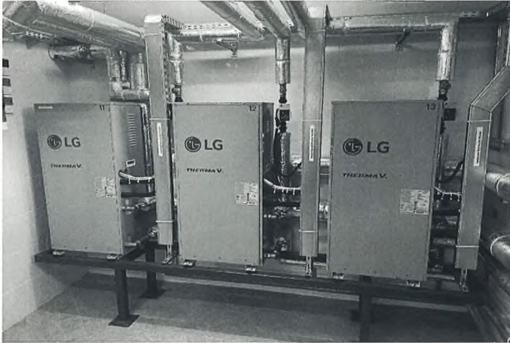
Pompa ciepła powietrze-woda 3x16kW