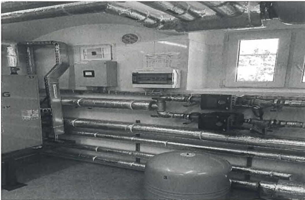
Naczynie wzbiorcze np. Reflex NG (3) : pompa obiegowa np.: Wilo Stratos MAXO, DN25 i pompa obiegowa np.: Wilo Stratos MAXO-D, DN32 (5).